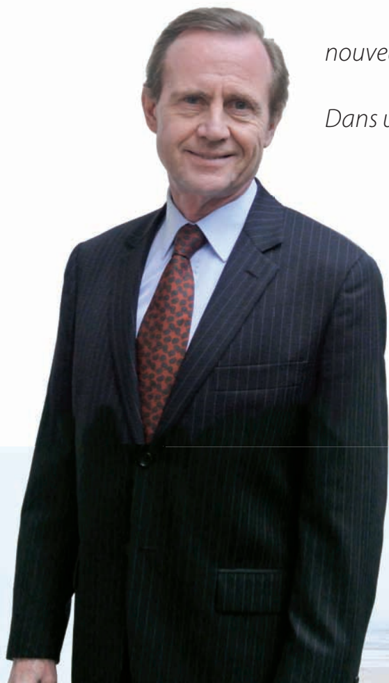
Didier DA RIN Président

Le monde rétrécit au fur et à mesure que la mobilité internationale se développe et que les distances diminuent. Vous êtes de plus en plus nombreux à résider à l'étranger, c'est pourquoi nous avons conçu des solutions d'assurances santé complètes et adaptées pour vous permettre de vivre l'expatriation en toute sérénité. Depuis plus de 30 ans, ACS est l'assurance spécialisée dans la santé des Expatriés et couvre les risques induits par ce nouveau modèle de vie nomade. Dans un monde qui bouge, ACS bouge avec vous !